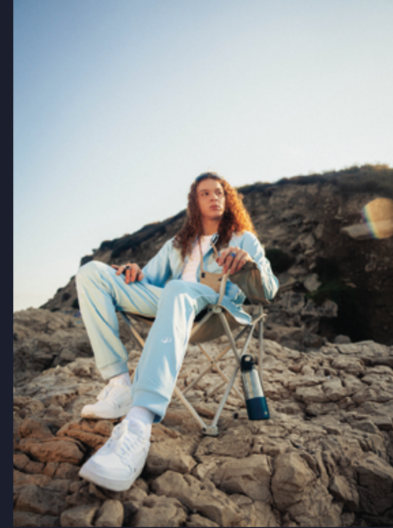
LOOK N°1 MARSEILLE 13

Pour conclure cet incroyable été olympique, les équipes design DECATHLON ont imaginé deux ensembles inclusifs avec une coupe unisexe, modelée pour la vie urbaine. Dans son quotidien comme lors d'une activité physique, enfiler ou retirer un vêtement n'est pas toujours aisé pour les personnes en situation de handicap. La problématique étant de ne pas démonter sa prothèse en s'habillant. Avec ces créations, DECATHLON questionne la place du vêtement de mode pour les personnes à mobilité réduite. Une réflexion menée avec des athlètes paralympiques du Team Athlètes DECATHLON et des membres de l'association Entraide, une association qui accompagne les personnes amputées fémorales. L'accent est mis sur la simplicité et la fonctionnalité, pour offrir aux corps un basique intemporel. Rendez-vous le 3 septembre pour les découvrir en ligne !