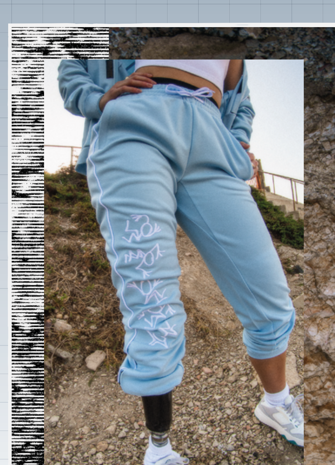
LOOK N°1 MARSEILLE 13