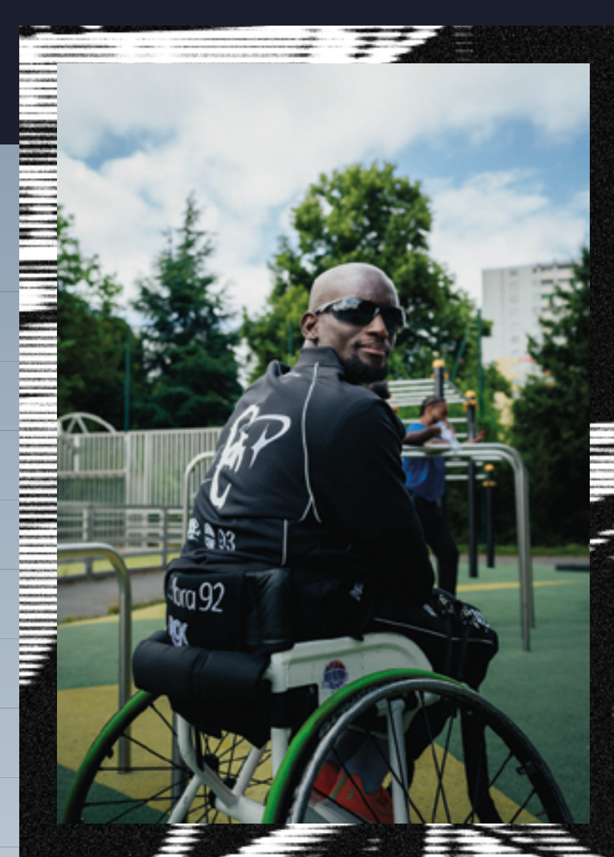
LOOK N°2 PARIS 93

le bas prix de vente conseillé : 45 euros TTC