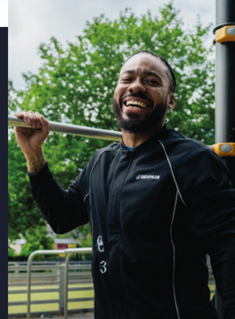
LOOK N°2 PARIS 93